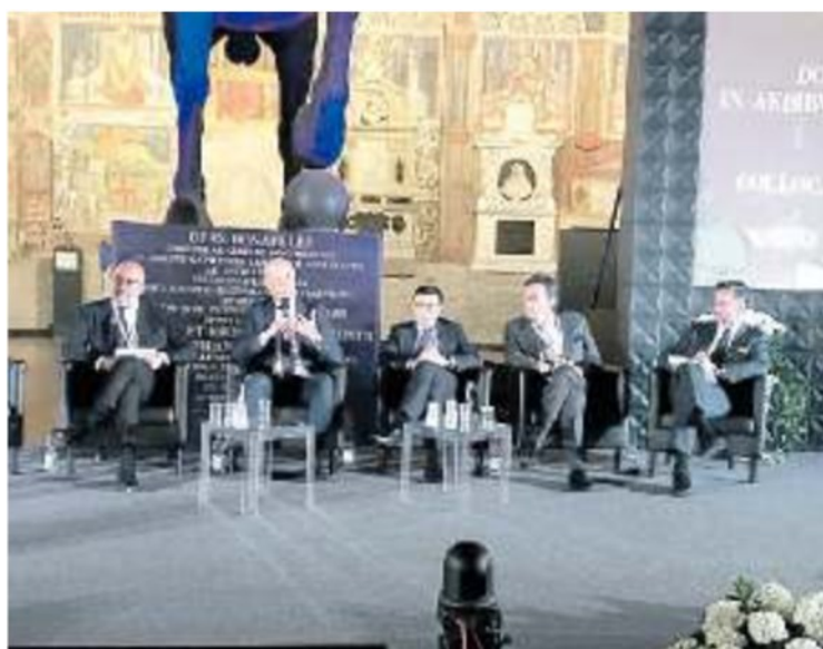
IL DIBATTITO Un momento della discussione al convegno di ieri