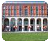
» Triennale di Milano