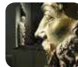
» Grande Museo del Duomo