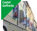
» MAST Castel Goffredo - Museo della città