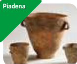
» Museo Archeologico Platina