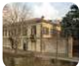
» Villa Manzoni - Museo Manzoniano, Pinacoteca