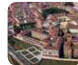
» Palazzo Ducale