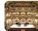
» Teatro Scientifico Bibiana