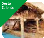
» Museo Civico Archeologico di Sesto Calende