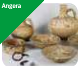
» Civico Museo Archeologico