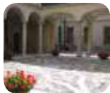
» Palazzo Morando - Costume Moda e Immagine