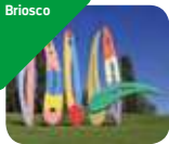
» Rossini Art Site