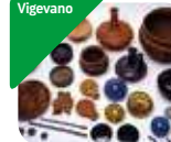
» Museo Archeologico Nazionale di Vigevano