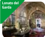
» Museo Casa del Podestà