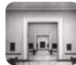
» Pinacoteca dell'Accademia Carrara