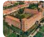
» Musei Civici del Castello Visconteo