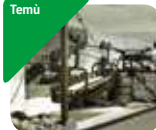
» Museo della Guerra Bianca in Adamello