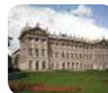
» Galleria d'Arte Moderna