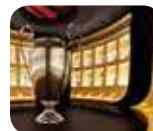
» Casa Milan - Museo Mondo Milan