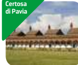
» Museo della Certosa di Pavia