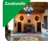
» Castello di Zavattarello e Museo d'Arte Contemporanea