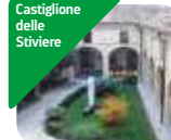
» Museo Internazionale della Croce Rossa