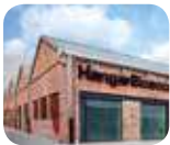
» Pirelli HangarBicocca