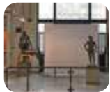
» Studio Museo Francesco Messina