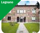
» Palazzo Leone da Perego