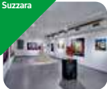
» Museo Galleria del Premio Suzzara