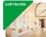
» Museo "Laus Pompeia"