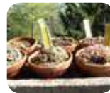
» Orto Botanico "Lorenzo Rota"