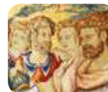
» Museo d'Arte e Scienza