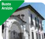
» Civiche Raccolte d'Arte di Palazzo Marliani Cicogna