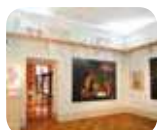
» Museo Diotti