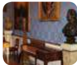
» Museo Teatrale alla Scala