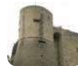
» Rocca - Museo Storico Sezione '800