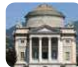
» Tempio Voltiano