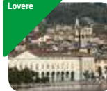
» Galleria dell'Accademia Tadini