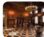
» Museo Bagatti Valsecchi