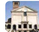
» Tempio di San Sebastiano