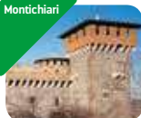
» Castello Bonorisi