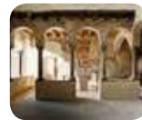
» Palazzo del Podestà/ Museo Storico/ Età Veneta/ Il '500 Interattivo