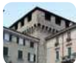
» Torre Viscontea - Spazio mostre