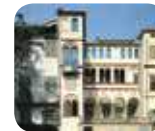
» Museo Adriano Bernareggi