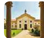
» MUBA - Museo dei Bambini Milano