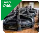
» Centrale idroelettrica di Crespi d'Adda