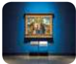
» Pinacoteca di Brera