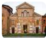
» Museo Archeologico "San Lorenzo"

Informazioni e orari di apertura: www.abbonamentomusei.it 800 329 329