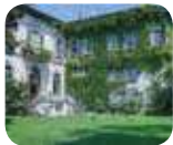
» Vigna di Leonardo