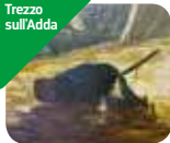
» Quadreria Crivelli