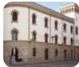
» Palazzo delle Paure - Galleria d'Arte Contemporanea, Osservatorio dell'Alpinismo