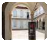
» Musei Civici di Monza - Casa degli Umiliati