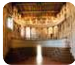
» Teatro all'Antica