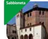
» Chiesa della Beata Vergine Incoronata