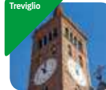
» Museo Storico Verticale