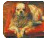
» Galleria d'Arte Moderna e Contemporanea - GAMeC