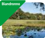
» Museo Civico Preistorico dell'Isolino Virginia