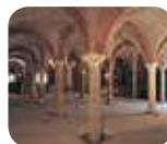
» Cripta di San Giovanni in Conca