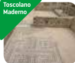
» Villa Romana di Toscolano Maderno