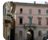
» Museo Storico "Giuseppe Garibaldi"