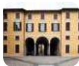
» Palazzo Belgiojoso - Museo Archeologico, Museo Storia Naturale, Museo Storico