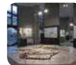
» Civico Museo Archeologico