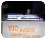
» Museo Interattivo del Cinema