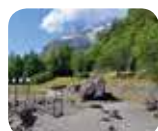
» Parco Archeologico della Preistoria dei Massi di Cemmo