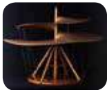
» Museo Nazionale della Scienza e della Tecnologia Leonardo da Vinci