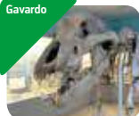
» Museo Archeologico della Valle Sabbia