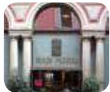
» Museo Poldi Pezzoli