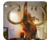
» Museo Civico di Scienze Naturali "E. Caffi"