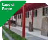
» Museo Nazionale della Preistoria della Valle Camonica