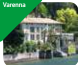
» Villa Monastero