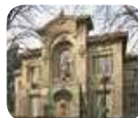
» Acquario Civico

Informazioni e orari di apertura: www.abbonamentomusei.it 800 329 329