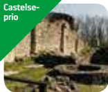
» Area Archeologica e Antiquarium di Castelseprio