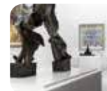
» Museo del Novecento