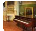
» Museo Donizettiano