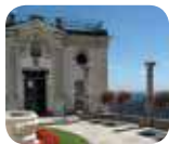
» Museo Baroffio e del Santuario del Sacro Monte sopra Varese