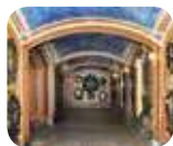
» Cappella Espiatoria