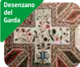
» Area Archeologica della Villa Romana