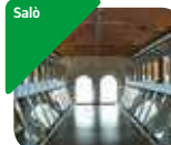
» MuSa - Museo di Salò