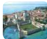
» Castello Scaligero