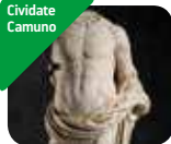
» Museo Archeologico Nazionale della Valle Camonica