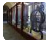
» Musei Civici "L. Barni" - Museo dell'imprenditoria Vigevanese