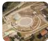
» Parco Archeologico del Teatro e dell'Anfiteatro