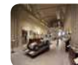
» Museo Tazio Nuvolari