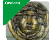
» Museo Archeologico dell'Alto Mantovano