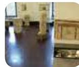
» Museo Civico Archeologico