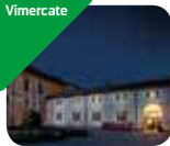
» MUST Museo del territorio vimercaese