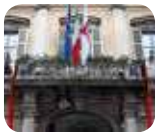
» Palazzo Moriggia - Museo del Risorgimento