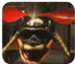
» Museo delle Culture: Collezione Permanente