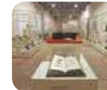
» Musei Civici "L. Barni" - Museo della Calzatura "Pietro Bertolini"