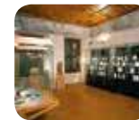
» Museo Valtellinese di Storia e Arte