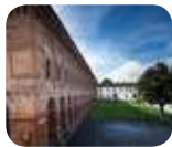
» Palazzo Giardino e Galleria degli Antichi