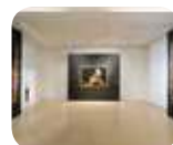
» Museo Lechi