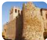
» Castello - ricetta di Desenzano del Garda