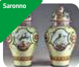
» Museo della Ceramica Giuseppe Gianetti