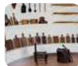
» Museo Bergomi