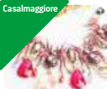
» Museo del Bijou