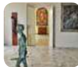
» GASC Galleria d'Arte Sacra dei Contemporanei