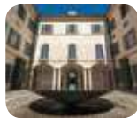
» Villa e Collezione Panza