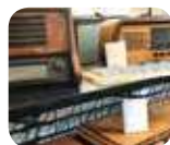
» Museo delle Industrie e del Lavoro del Saronese