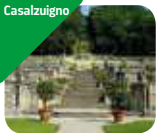
» Villa Della Porta Bozzolo