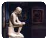
» Museo Civico Ala Pinzone - Pinacoteca