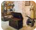
» Museo Mangini Bonomi