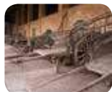
» Museo Civico della Civiltà Contadina "Il Cambonino Vecchio"