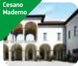
» Palazzo Arese Borromeo