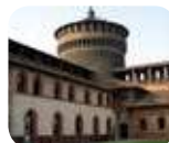
» Musei del Castello Sforzesco