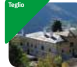
» Palazzo Besta e Museo Archeologico