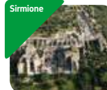
» Area Archeologica delle Grotte di Catullo e Museo Archeologico di Sirmione