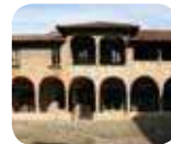
» Convento di San Francesco/ Museo Storico/ Museo della fotografia Sestini