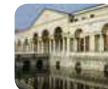
» Museo Civico di Palazzo Te