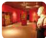
» Museo Civico di Storia Naturale