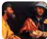
» Pinacoteca Tosio Martinengo