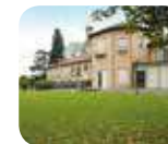
» Civici Musei di Villa Mirabello e Risorgimento