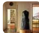
» Casa Museo Boschi Di Stefano