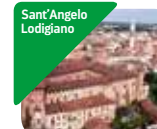
» Musei del Castello Bolognini