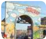
» WOW Spazio Fumetto