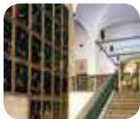
» Museo Diocesano Carlo Maria Martini