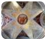
» Villa Reale di Monza