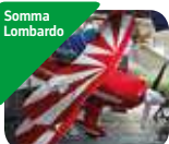
» Volandia Parco e Museo del Volo