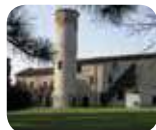
» Musei del Castello - Museo del Risorgimento e Museo delle Armi "Luigi Marzoli"