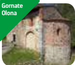
» Monastero di Torba