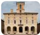
» Palazzo Ducale - Sabbioneta