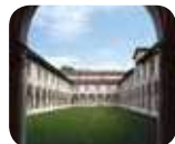
» Museo di Santa Giulia