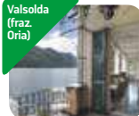
» Villa Fogazzaro Roi