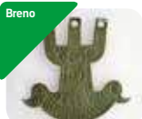
» Parco Archeologico del Santuario di Minerva