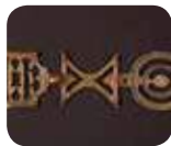
» Museo Castiglioni