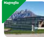
» Museo del Ciclismo Madonna del Ghisallo