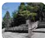
» Parco Nazionale delle Incisioni Rupestri