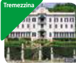
» Villa Carlotta - Museo e Giardino Botanico