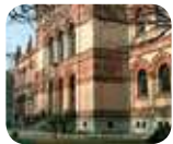
» Museo di Storia Naturale