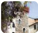
» Civico Museo di Arte Moderna e Contemporanea Castello di Masnago