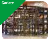
» Museo della Seta Abegg