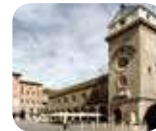
» Palazzo della Ragione e Torre dell'Orologio