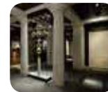
» Museo e Tesoro della Cattedrale