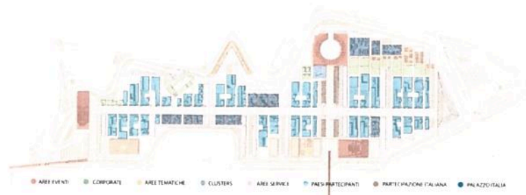
Figura 1. Masterplan di Expo 2015

Il Sito espositivo è situato a Nord-Ovest di Milano, in prossimità del Polo Fieristico di Rho-Pero (Fiera Milano) e si estenderà approssimativamente su una superficie di circa 1 milione di metri quadrati. L'area espositiva è stata progettata come un unico paesaggio – un'isola circondata da un canale d'acqua – strutturata intorno a due assi perpendicolari di forte valore simbolico: il Decumano e il Cardo, elementi ordinatori delle antiche città romane. Il Sito, concepito come un'area espositiva all'aperto, è caratterizzato dall'abbondanza di zone verdi che occuperanno una superficie di oltre 280.000 metri quadrati. Ciascun Paese Partecipante sarà invitato ad esprimere la propria personale interpretazione del tema sui lotti allineati lungo i principali assi del Sito, il Decumano o World Avenue.