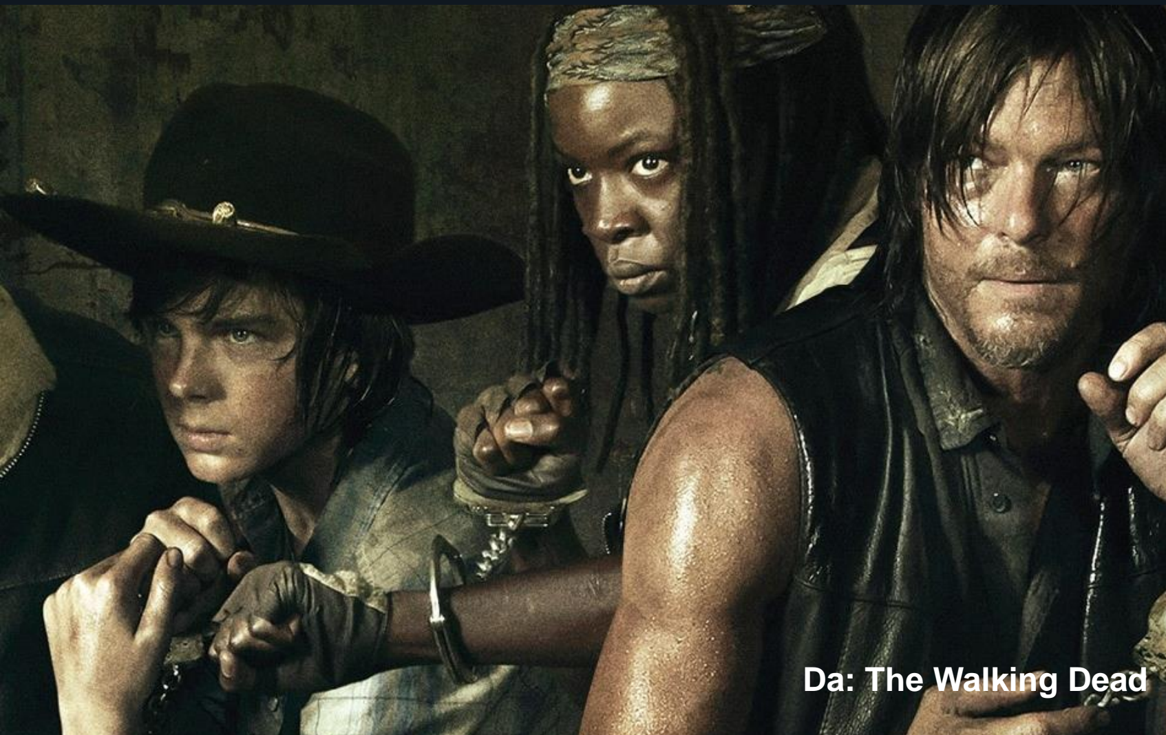
Da: The Walking Dead

3. Innovare richiede una strategia adattativa. Anche piccoli passi hanno un valore enorme.