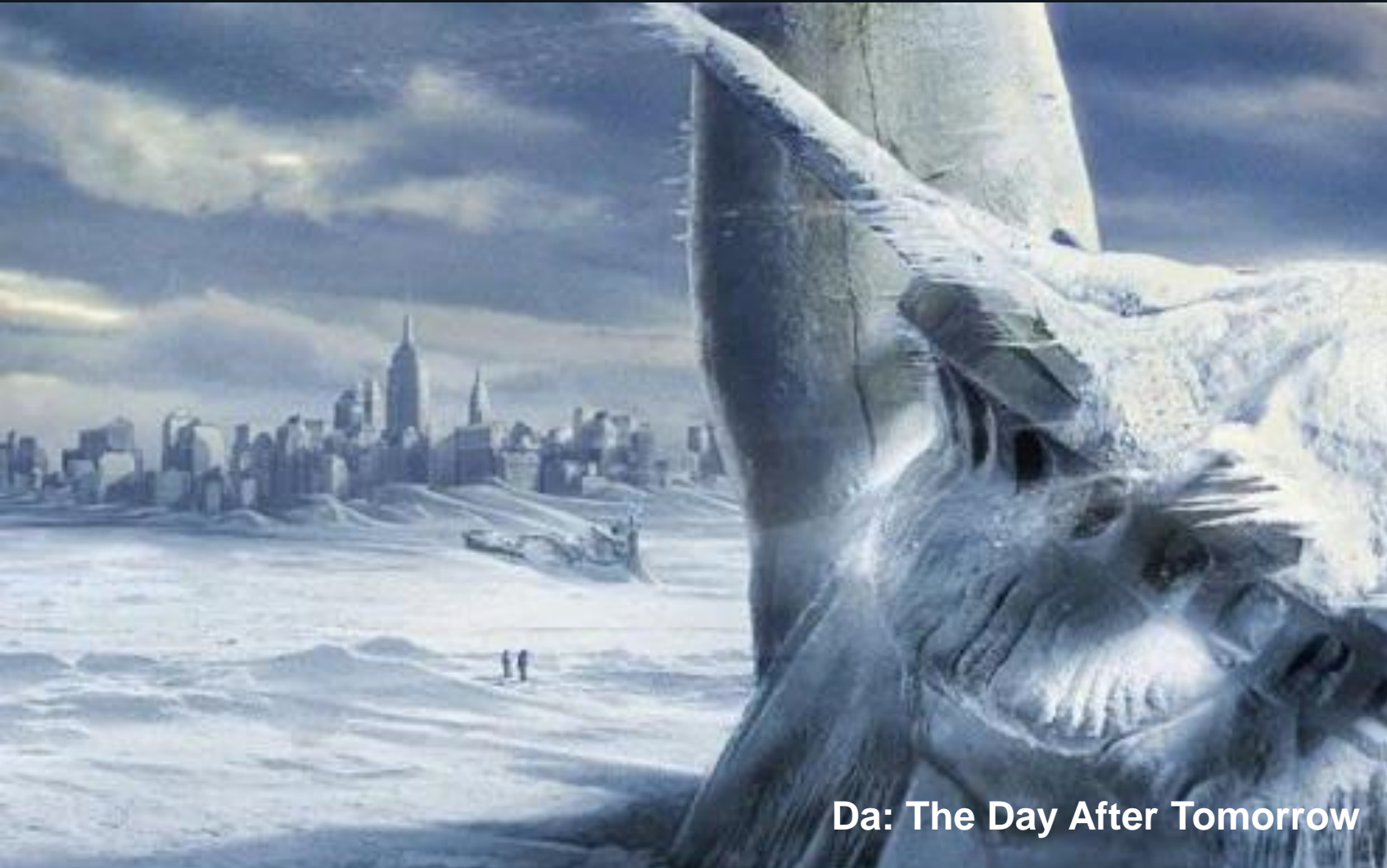
Da: The Day After Tomorrow

« Gli avvertimenti di un climatologo sull'imminente arrivo di una nuova era glaciale vengono ignorati. »