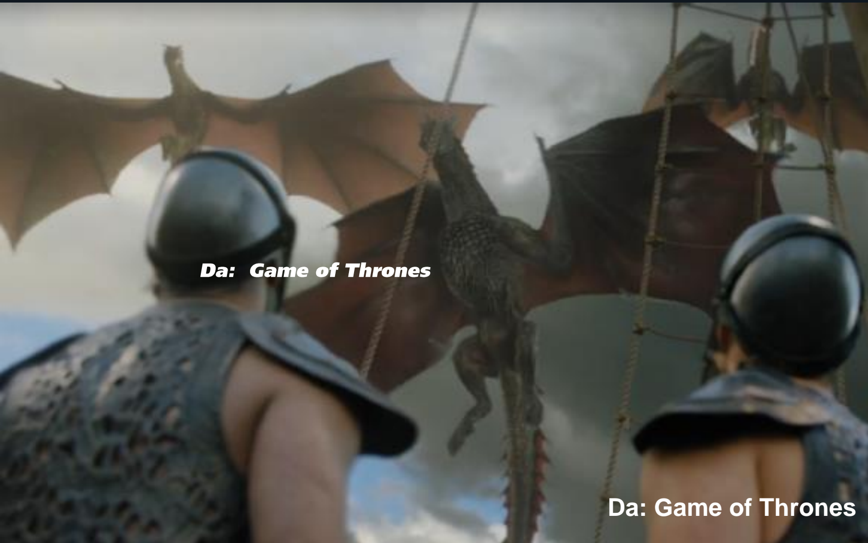
Da: Game of Thrones