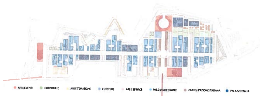
Figura 1. Masterplan di Expo 2015

È un evento della durata di 6 mesi che avrà luogo in Italia, a Milano, dal 1 maggio al 31 ottobre 2015 : nel corso di questo periodo è prevista la partecipazione di 20 milioni di visitatori e di 147 Paesi più Organizzazioni Internazionali, Fondazioni e società civili e la realizzazione di oltre 2.000 eventi che spazieranno dai dibattiti ai congressi, dai convegni sulle politiche alimentari agli eventi culturali e gastronomici secondo una matrice articolata in tre macro-settori: 'Scientifico-tecnologico', 'Socio-culturale' e 'Cooperazione per lo sviluppo'. Il Sito espositivo è situato a Nord-Ovest di Milano, in prossimità del Polo Fieristico di Rho-Pero (Fiera Milano) e si estenderà approssimativamente su una superficie di circa 1 milione di metri quadrati. L'area espositiva è stata progettata come un unico paesaggio – un'isola circondata da un canale d'acqua – strutturata intorno a due assi perpendicolari di forte valore simbolico: il Decumano e il Cardo, elementi ordinatori delle antiche città romane. Il Sito, concepito come un'area espositiva all'aperto, è caratterizzato dall'abbondanza di zone verdi che occuperanno una superficie di oltre 280.000 metri quadrati. Ciascun Paese Partecipante sarà invitato ad esprimere la propria personale interpretazione del tema sui lotti allineati lungo i principali assi del Sito, il Decumano o World Avenue.